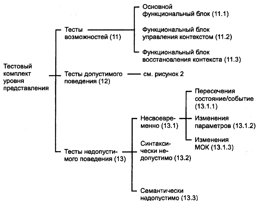
Рисунок 1 — Структура тестового комплекта уровня представления

Каждая из этих групп подразделена на ряд тестовых групп более низкого уровня. Полная структура большинства тестовых групп дана на рисунках 1 и 2.